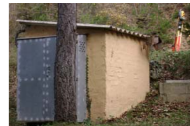
Vista lateral (bateria de condensadors)