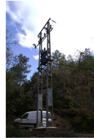
Torre alta tensió