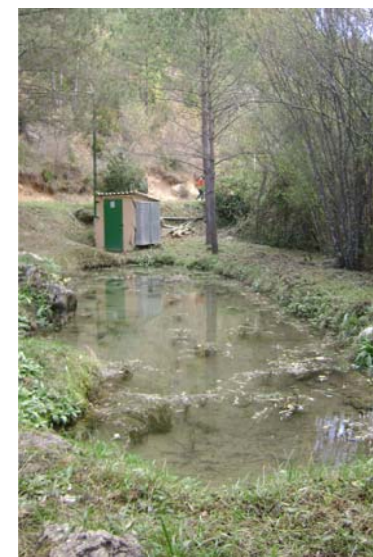
Caseta captació i bassa