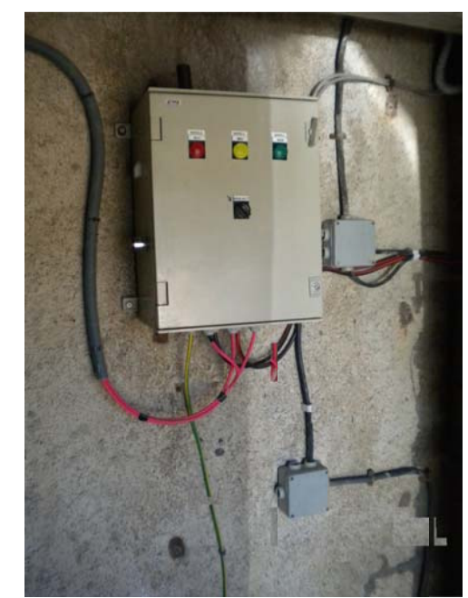
FOTOGRAFIES ESTAT ACTUAL

*NOTA: PER LA PROPOSTA D'AQUEST PROJECTE ES MANTINDRÀ LA UBICACIÓ DELS ELEMENTS DEL DIPÒSIT, (PAS DE LA TUBERIA, COMPTADOR I AIXETA) ENCARA QUE ES SUBSTITUIRAN PER UNS DE NOUS.